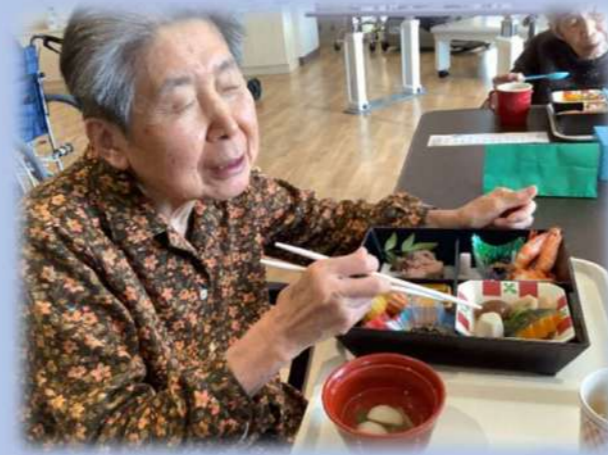
2階フロア-職員の商品