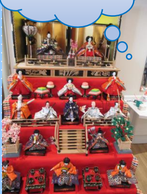
3階フロアー お雛様飾り