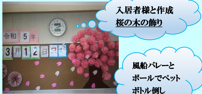
入居者様と作成 桜の木の飾り