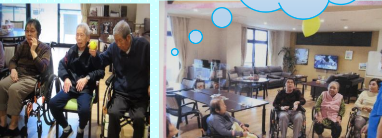
風船パレーと ボールでペット ボトル倒し