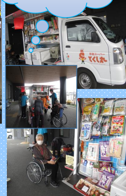
移動販売も再開さ れお買い物を楽し みにされています