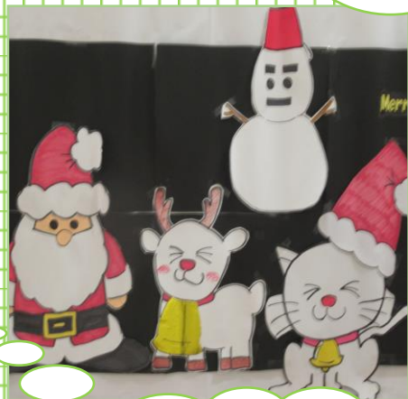
3階フロア 入居者様・職員が作成 のクリスマス飾り

12月初旬よりクリスマスや年末忘年会などの準備をしておりましたが、コロナウイルス感染症拡大の為、全催しが中止となりました 来年こそはクリスマスやいろいろな催しが盛大にできる事を願っています