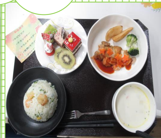
クリスマスメニューの昼食 ピラフにクラムチャウダーにケーキとクリスマスらしいメニューで皆様とても喜ばれていました

12月初旬よりクリスマスや年末忘年会などの準備をしておりましたが、コロナウイルス感染症拡大の為、全催しが中止となりました 来年こそはクリスマスやいろいろな催しが盛大にできる事を願っています